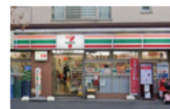
セブンイレブン横浜井土ヶ谷中町店