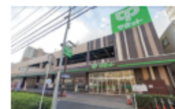
サミットストア井土ヶ谷店