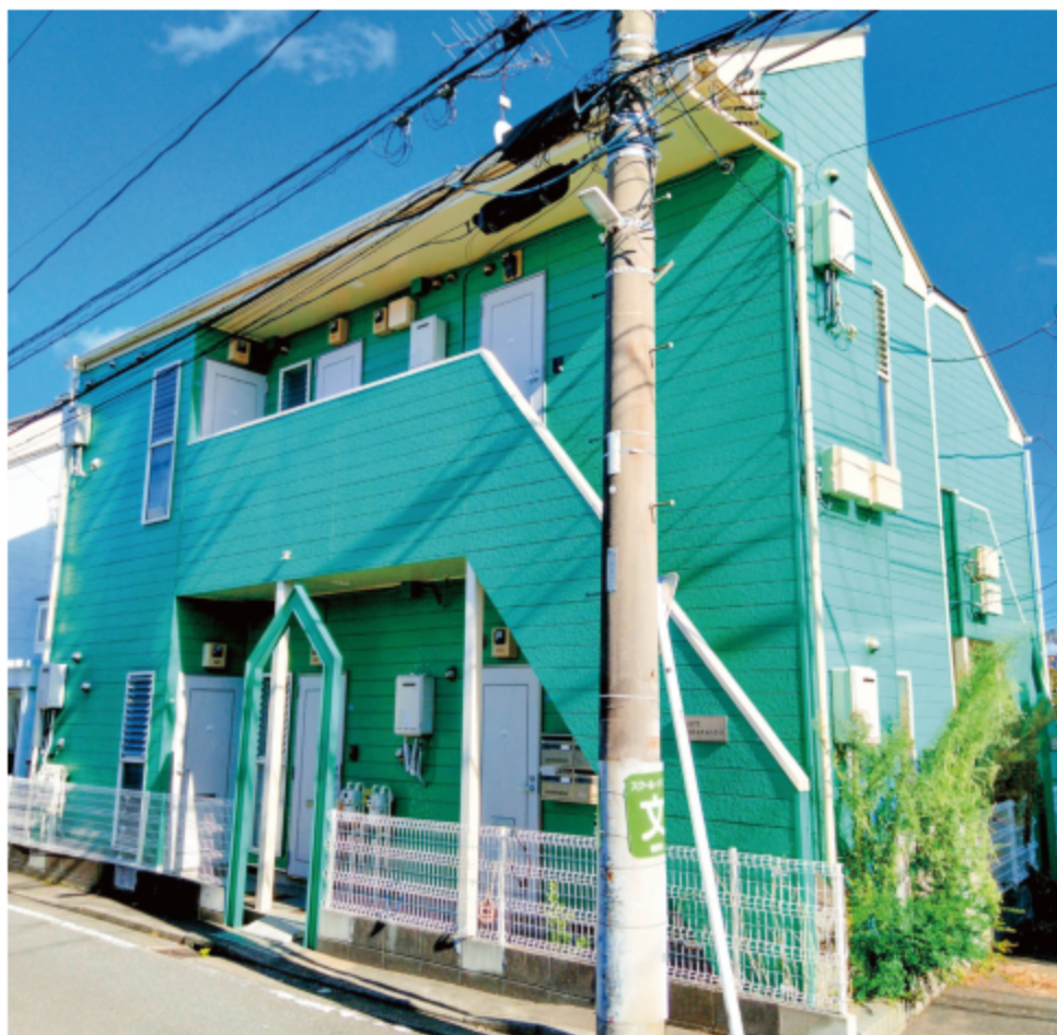
※写真は全て現地にて撮影したものです。(令和3年10月撮影)

※上記予定利回りは、家賃価格に対する年間の予定賃料収入(共益費等を含む)の割合で、公租公課その他の出納義務を維持するために必要金費月の控除前のものです。また、賃料を保証するものではありません。