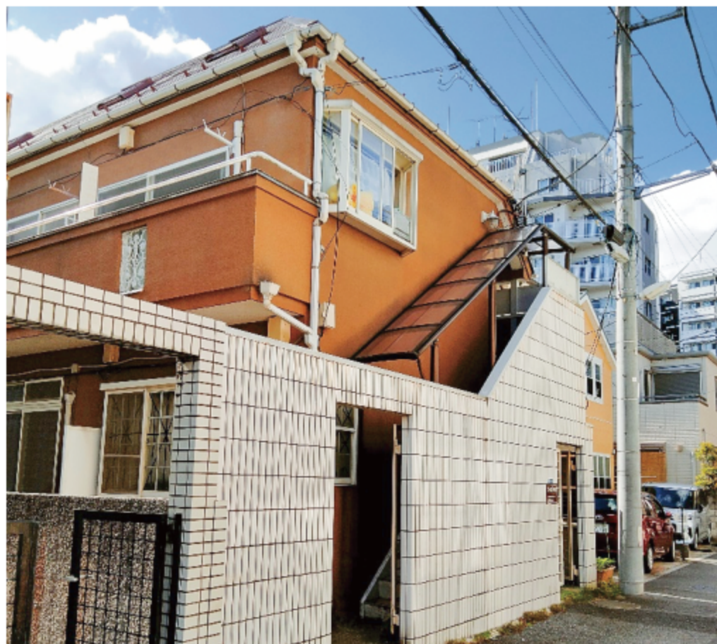
※写真は全て現地にて撮影したものです。(令和3年8月撮影)

※上記予定利回りは、家賃価格に対する年間の予定賃料収入(共益費等を含む)の割合で、公営公団その他当該物件を維持するために必要経費の控除前のものです。また、賃料を保証するものではありません。