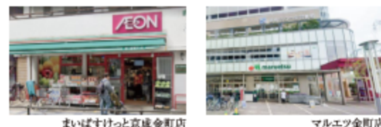
まいばすけっと京成金町店