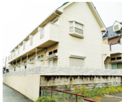
※写真は全て現地にて撮影したものです。(令和3年7月撮影)(弊社修繕・管理前)