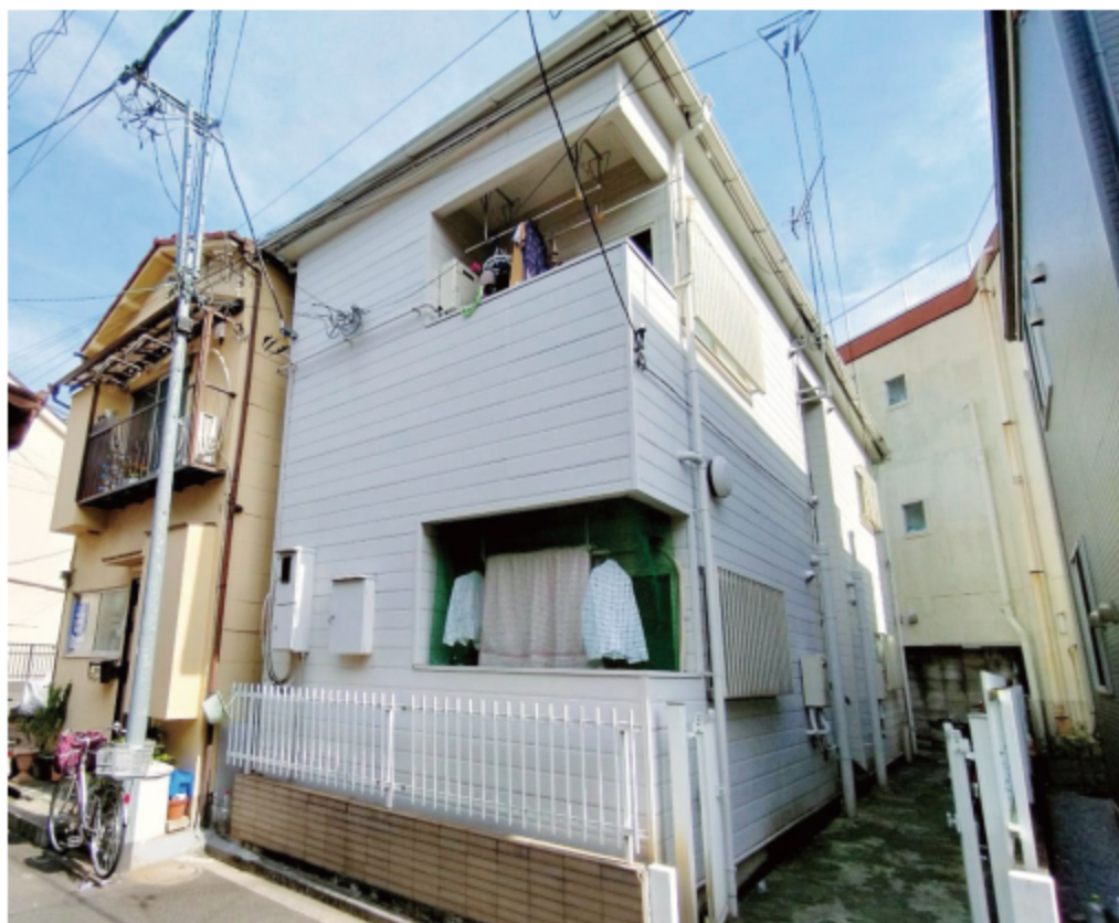
※写真は全て現地にて撮影したものです。(令和3年8月撮影)

※上記予定利回りは、家賃価格に対する年間の予定賃料収入(共益費等を含む)の割合で、公租公課その他の支出諸物件を維持するために必要費用の控除前のものです。また、賃料を保証するものではありません。