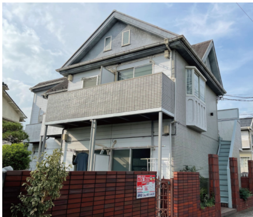
※写真は全て現地にて撮影したものです。(令和3年7月撮影)

※上記予定利回りは、家賃価格に対する年間の予定賃料収入(共益費等を含む)の割合で、公租公課その他当該物件を維持するために必要な費用の控除前のものです。また、賃料を保証するものではありません。