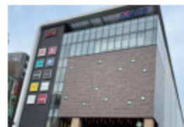
トリエ京王調布C館