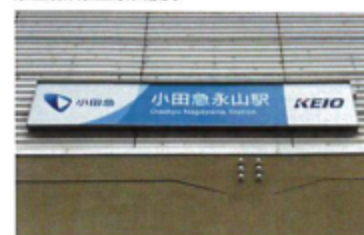
小田急線「小田急永山」駅

■所在地/■所在地/東京都多摩市永山一丁目■土地面積/195.04m 2 (約59.00坪)■面積基準/公簿■地目/宅地■駐車場/無■土地権利/所有権■構造/木造スレート葺2階建て■築年月/昭和63年4月■延床面積/172.24m 2 (52.10坪)1階86.12m 2 2階86.12m 2 ■間取り/1K×8戸■建蔽率/60%■容積率/200%■現況/賃貸中■都市計画/市街化区域■用途地域/第2種中高層住居専用地域■防火地域/準防火■接道状況/南東側幅員約12m公道■その他の法令上の制限/第2種高度地区、準防火地域、宅地造成等規制法都立自然公園(多摩丘陵、普通地域)、東京都景観計画(丘陵地景観基本軸)■施設/バストイレ別、室内洗濯機置場、TVモニターホン■水道/公営■ガス/プロパン■汚水/公共下水■雑排水/公共下水■引渡時期/相談※収入は賃貸中のものについては現在の賃料で、空室中の部屋については周辺相場(賃料)に基づき満室となった場合を想定して表示しています。利回りは現況または満室での単純利回り(年間賃料総額÷購入価格)で、登記費用・固定資産税・管理費等の必要経費は考慮されておりません。また、賃料収入や利回りは将来にわたって確実に得られることを保証するものではありません。※間取り図や敷地図は現況と相違する場合があります。その場合現況を優先します。