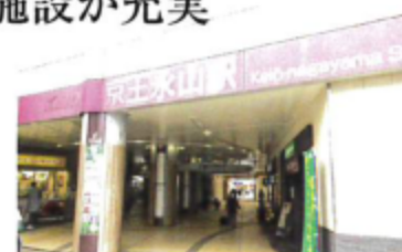
京王線「京王永山」駅