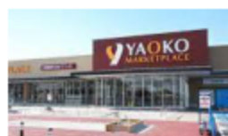
ヤオコー川越霞ヶ関店