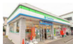
ファミリーマート川越霞ヶ関店

■所在地/埼玉県川越市霞ヶ関東■最寄駅/東武東上線「霞ヶ関」駅徒歩9分■土地面積/184.74㎡■建物床面積/195.84㎡ ■面積基準/公簿■地目/宅地■駐車場/なし■土地権利/所有権■構造/鉄骨造スレート葺2階建■築年月日/1988年9月■建蔽率/60%/60%■容積率/200%/100%■用途地域/第一種住居地域/第一種低層住居専用地域■高度地区/なし■防火地区/建築基準法第22条区域■道路/公道(幅員約6m 42条1項1号道路)■引渡し時期/相談 利回りは満室での単純利回り(年間総賃料+購入価格)で、登記費用・固定資産税・管理費等の必要経費は考慮されておりません。また、賃料収入や利回りは将来にわたって確実に得られることを保証するものではありません。※間取り図や敷地図面は現況と相違する場合があります。その場合、現況を優先します。