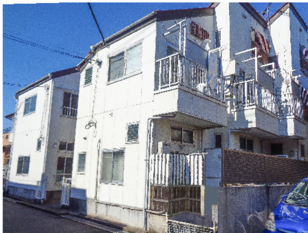
※写真は全て現地にて撮影したものです。(令和4年2月撮影)

※上記予定利回りは、家賃価格に対する年間の予定賃料収入(共益費等を含む)の割合で、公租公課その他諸物件を維持するために必要な費用の控除前のものです。また、賃料を保証するものではありません。