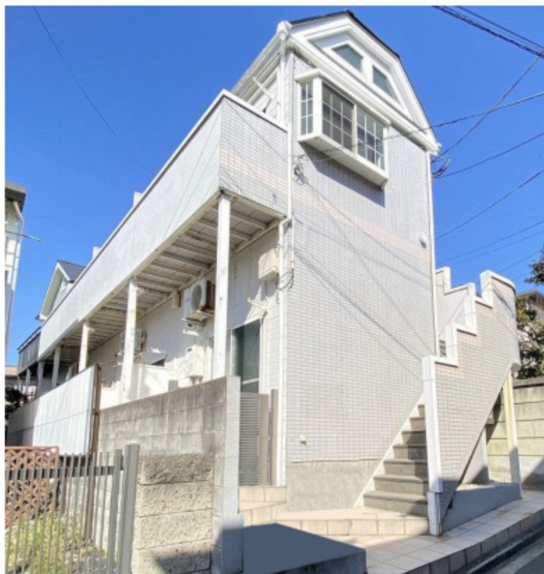
※写真は全て現地にて撮影したものです。(令和4年2月撮影)

※上記予定利回りは、家賃価格に対する年間の予定賃料収入(共益費等を含む)の割合で、公租公課その他当該物件を維持するために必要となる費用の控除前のもです。また、賃料を保証するものではありません。