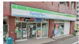
ファミリーマート中野大和町四丁目店

■所在地/中野区大和町■最寄駅/JR中央線「高円寺」駅徒歩15分・JR中央線「高円寺」駅バス3分・「大和町三丁目」バス停徒歩6分・西武新宿線「野方」駅徒歩13分■土地面積/70.41㎡(セットバック部分6.10㎡を含む)■建物床面積/67.08㎡■面積基準/公簿■地目/宅地■駐車場/なし■土地権利/所有権■構造/木造スレート葺2階建■築年月日/1987年4月■建蔽率/60%■容積率/150%■用途地域/第一種低層住居専用地域■高度地区/第一種防火地区/準防火地域■道路/公道(幅員約2.1m)■引渡し時期/相談 利回りは満室での単純利回り(年間総賃料÷購入価格)で、登記費用・固定資産税・管理費等の必要経費は考慮されておりません。また、賃料収入や利回りは将来にわたって確実に得られることを保証するものではありません。※間取り図や敷地図面は現況と相違する場合があります。その場合、現況を優先します。