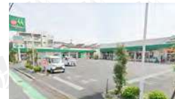
マルエツ中野若宮店