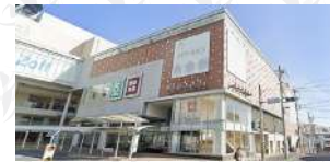
東急ストアたまプラーザテラス店