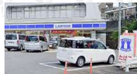
ローソン川崎有馬九丁目店

■所在地/川崎市宮前区鷺沼 ■最寄駅/東急田園都市線「たまプラーザ」駅徒歩17分(自転車6分約1.3km) ■土地面積/134.54㎡(2棟合計) ■建物床面積/I:63.52㎡・II:120.80㎡ ■面積基準/公簿 ■地目/宅地 ■駐車場/なし ■土地権利/所有権 ■構造/木造スレート葺3階建(3階部分はロフト) ■築年月日/1991年12月 ■建蔽率/60% ■容積率/200% ■用途地域/準住居地域 ■高度地区/第3種 ■防火地区/準防火地域 ■その他制限/宅地造成工事規制区域 ■道路/東側公道(幅員約8.15m)、西側公道(幅員約7.01m) ■引渡し時期/相談 利回りは満室での単純利回り(年間総賃料÷購入価格)で、登記費用・固定資産税・管理費等の必要経費は考慮されておりません。また、賃料収入や利回りは将来にわたって確実に得られることを保証するものではありません。 ※間取り図や敷地図は現況と相違する場合があります。その場合、現況を優先します。