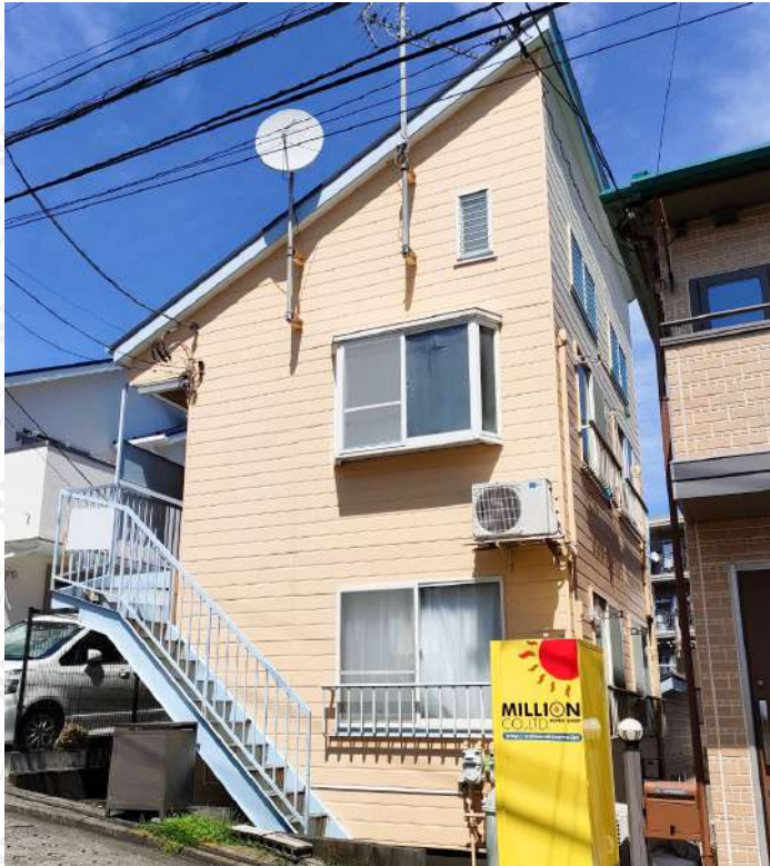
b'CASA たまプラーザ I re-born

※上記予定利回りは、販売価格に対する年間の予定賃料収入(共益費等を含む)の割合で、公租公課その他当該物件を維持するために必要な費用の控除前のもです。また、賃料を保証するものではありません。