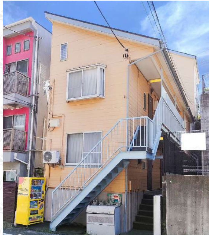
b'CASA たまプラーザ II re-born