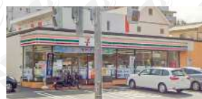
セブンイレブン多摩永山2丁目店