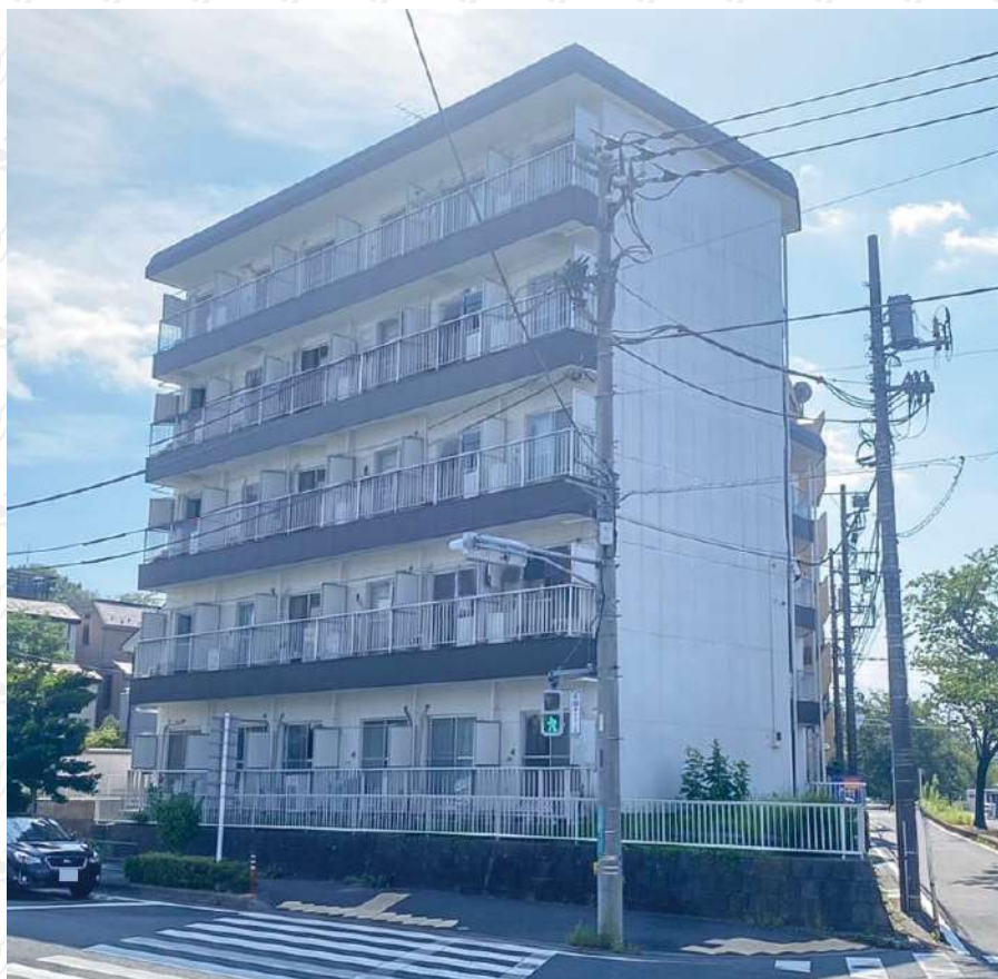
※写真は全て現地にて撮影したものです。(令和4年8月撮影)

※上記予定利回りは、販売価格に対する年間の予定賃料収入(共益費等を含む)の割合で、公租公課その他当該物件を維持するために必要な費用の控除前のもです。また、賃料を保証するものではありません。