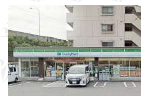
ファミリーマート坂戸駅南けやき通り店