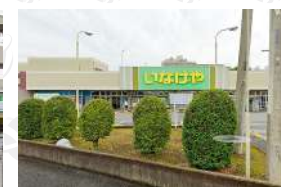
いなげや鶴ヶ島店