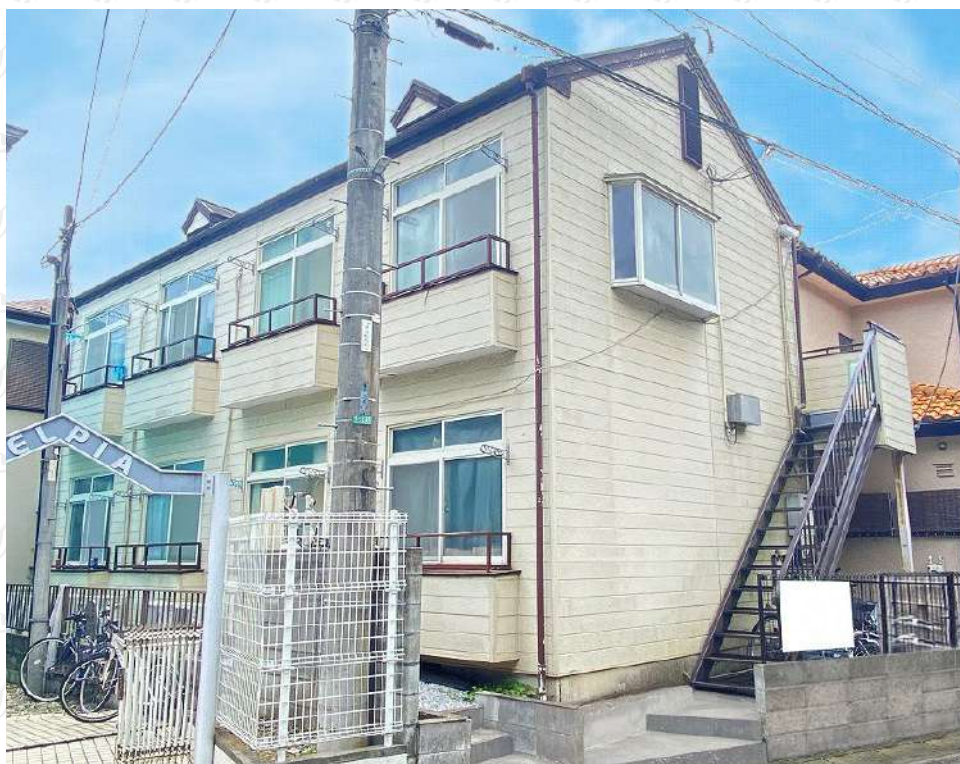
※写真は全て現地にて撮影したものです。(令和4年8月撮影)

※上記予定利回りは、販売価格に対する年間の予定賃料収入(共益費等を含む)の割合で、公租公課その他当該物件を維持するために必要な費用の控除前のものです。また、賃料を保証するものではありません。