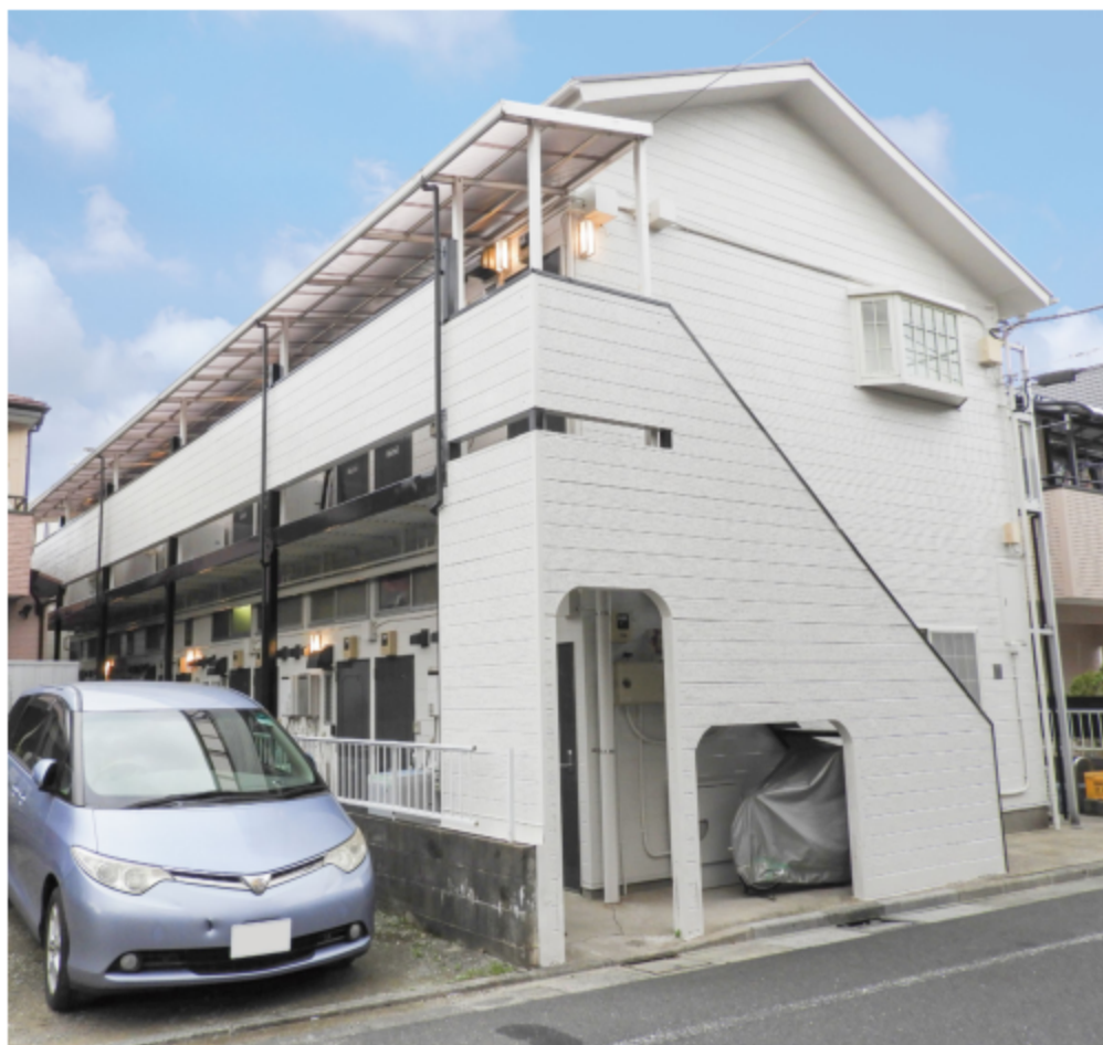
※写真は全て現地にて撮影したものです。(令和3年10月撮影)

※上記予定利回りは、家賃価格に対する年間の予定賃料収入(共益費等を含む)の割合で、公租公課その他諸物件を維持するために必要費用の控除前のものです。また、賃料を保証するものではありません。