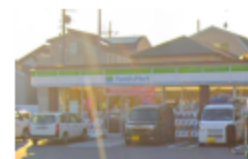
ファミリーマート鹿骨二丁目店