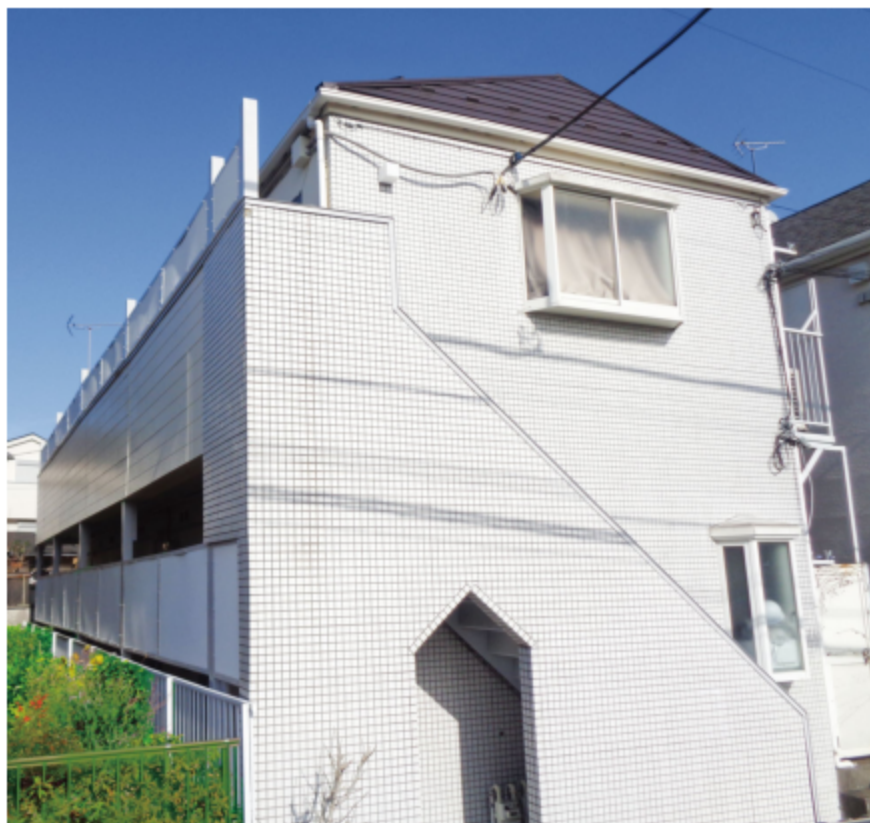
※写真は全て現地にて撮影したものです。(令和4年2月撮影)

※上記予定利回りは、家賃価格に対する年間の予定賃料収入(共益費等を含む)の割合で、公租公課その他当該物件を維持するために必要費用の控除前のものです。また、賃料を保証するものではありません。