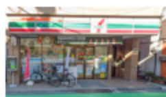
セブンイレブン中野新井薬師前駅北店

■所在地/東京都中野区松が丘1丁目 ■最寄駅/西武新宿線「新井薬師前」駅徒歩7分・「沼袋」駅徒歩10分・JR中央線「中野」駅バス約13分 ■土地面積/127.27㎡(セットバック部分約2.4㎡を含む) ■建物床面積/139.33㎡ ■面積基準/公得 ■地目/宅地 ■駐車場/なし ■土地権利/所有権 ■構造/木造スレート葺2階建 ■築年月日/1990年9月 ■建蔽率/60% ■容積率/150% ■用途地域/第一種低層住居専用地域 ■高度地区/第一種 ■防火地区/準防火地域 ■道路/公道(42条2項道路 幅員約3.3m) ■引渡し時期/相談 利回りは満室での単純利回り(年間総賃料÷購入価格)で、登記費用・固定資産税・管理費等の必要経費は考慮されておりません。また、賃料収入や利回りは将来にわたって確実に得られることを保証するものではありません。※間取り図や敷地面図は現況と相違する場合があります。その場合、現況を優先します。