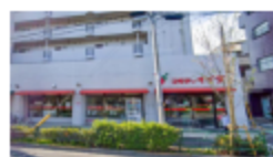
コモディイダ沼袋店