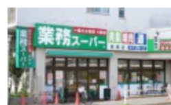
業務スーパー柴崎店