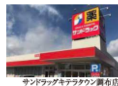
サンドラッグキテラタウン調布店