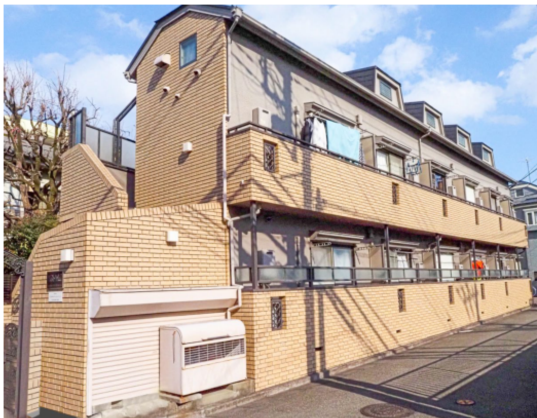
※写真は全て現地にて撮影したものです。(令和4年3月撮影)

※上記予定利回りは、家賃価格に対する年間の予定賃料収入(共済費等を含む)の割合で、公租公課その他の当該物件を維持するために必要な費用の控除前のものです。また、賃料を保証するものではありません。